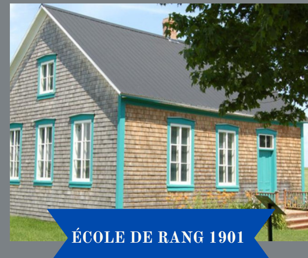
ÉCOLE DE RANG 1901